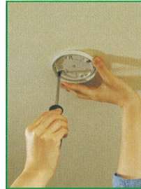
ベースを取り付ける

まもるくん10は、電池式なので配線工事が不要です。取付ネジ2本で固定するだけです。